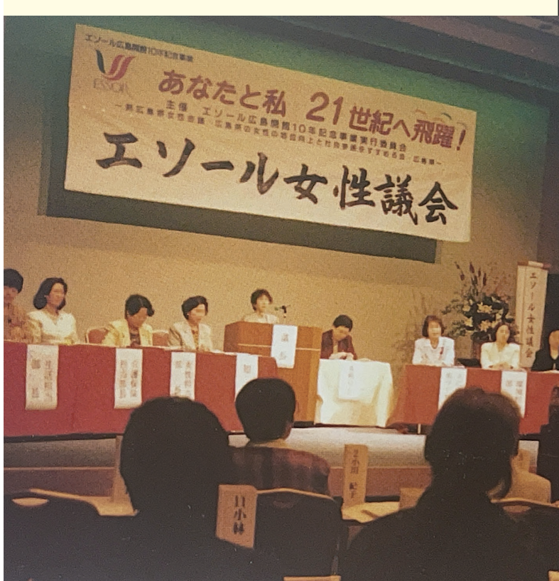
エソールフェスティバル

エソール広島開館10年記念エソールフェスティバル 「広島県男女共同参画プラン」策定 「青少年女性課男女共同参画推進班」設置（青少年女性課女性係を改組） 広島県男女共同参画推進本部設置