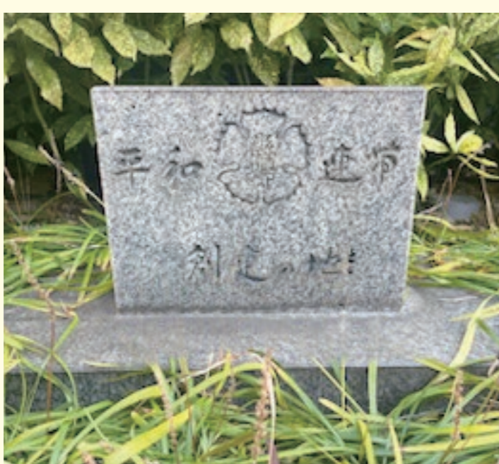
富士見町のエソール広島跡地に 建てられたヒルトン広島の敷地 内に移設された『創建の地』碑

2022年 ／令和4年 1月～3月、コロナ影響で臨時休館 専門家による相談会及び支援者への助言会開催(年2回) 富士見町跡地に建てられたヒルトン広島の敷地内に、エソ ール広島の前身「広島県婦人会館」を1951年に建設した 「広島県地域婦人団体連絡協議会」の『創建の地』石碑再設置 若年層対象の「セクシュアリティ教育講演会」を共催