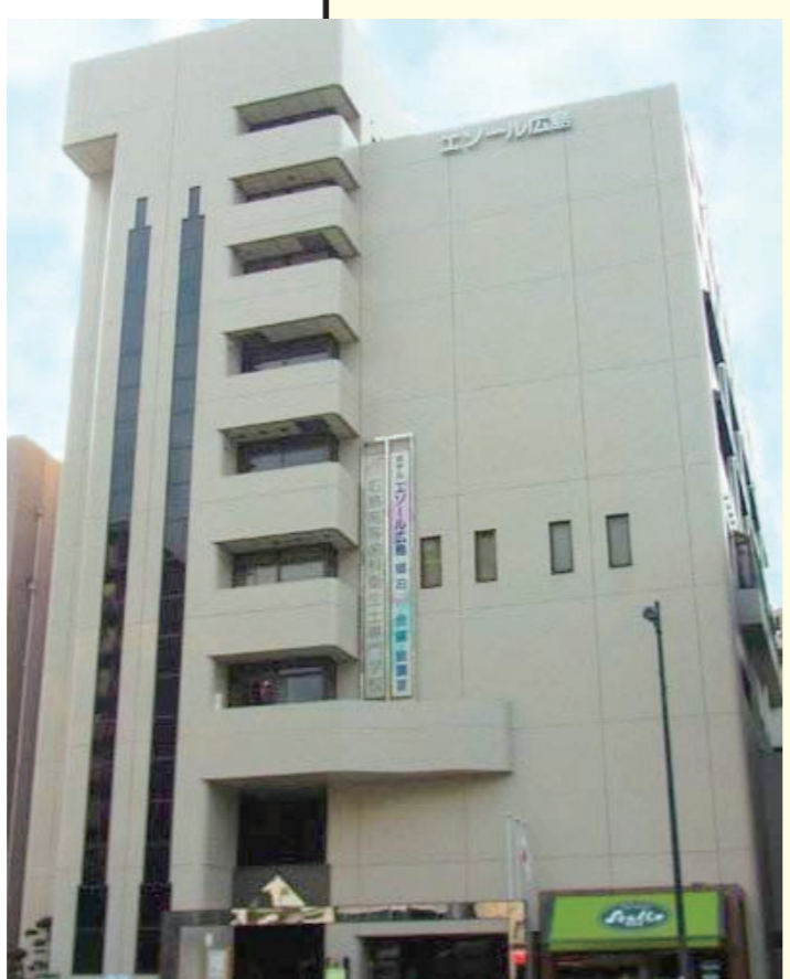
1989年オープン の 広島県婦人総合センター・エッソール広島

1987年 昭62年 広島県、広島県歯科医師会、広島県国民健康保険団体連合会、広島県住宅供給公社の4者で婦人総合センター建設工事を契約、工事が着工