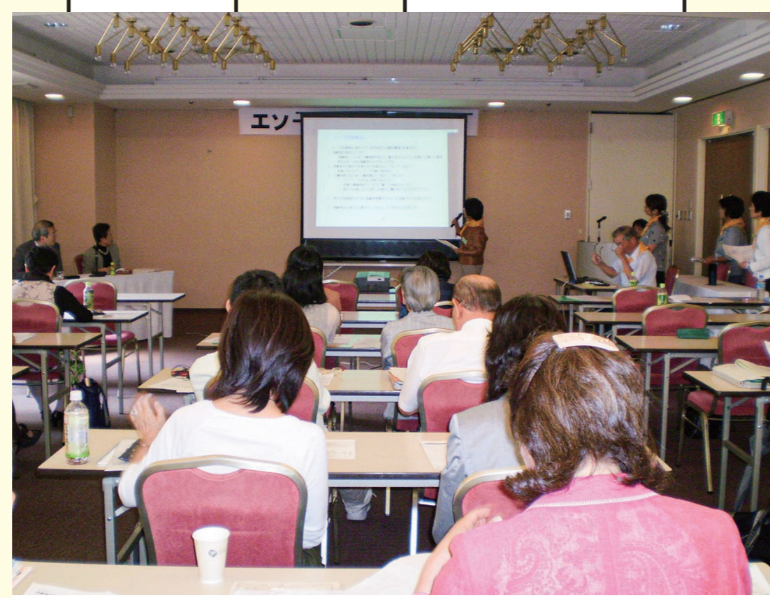
エソールひろしま大学 (2008年撮影)