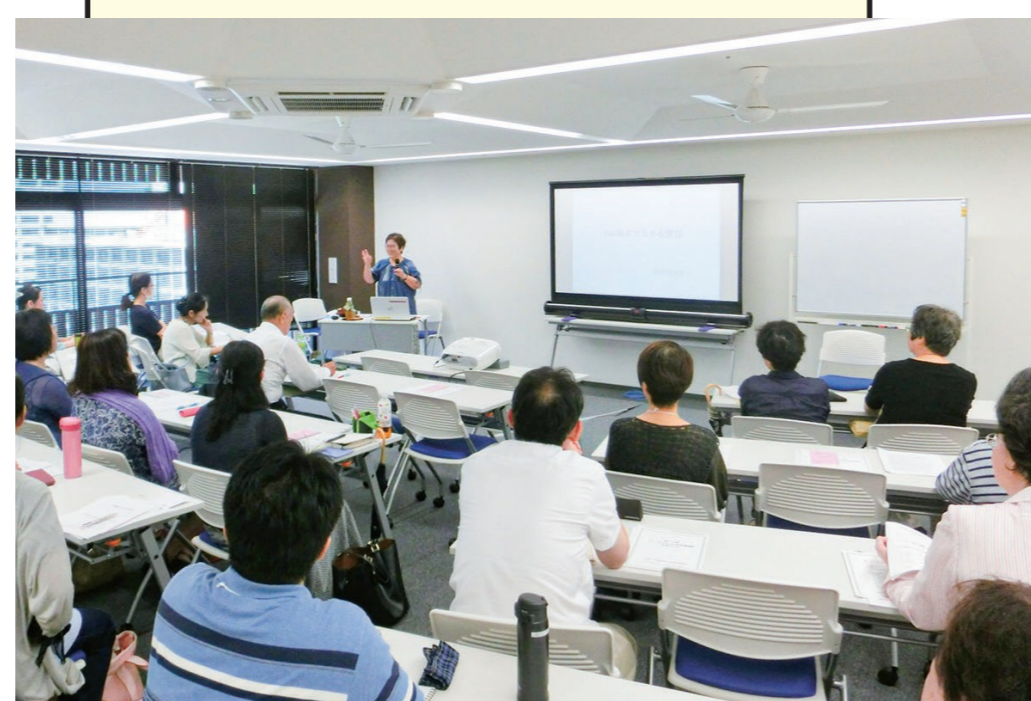
エソールひろしま大学 (2018年撮影)

2020年 ／令和2年 コロナ拡大の影響でエソールひろしま大学休止、講座や研修 事業は中止または延期に 4～5月、コロナ影響で夜間閉館、相談業務以外全業務休止 「新型コロナウイルス禍が女性に及ぼす影響についての緊急 アンケート」実施 エソール広島YouTubeチャンネル開設