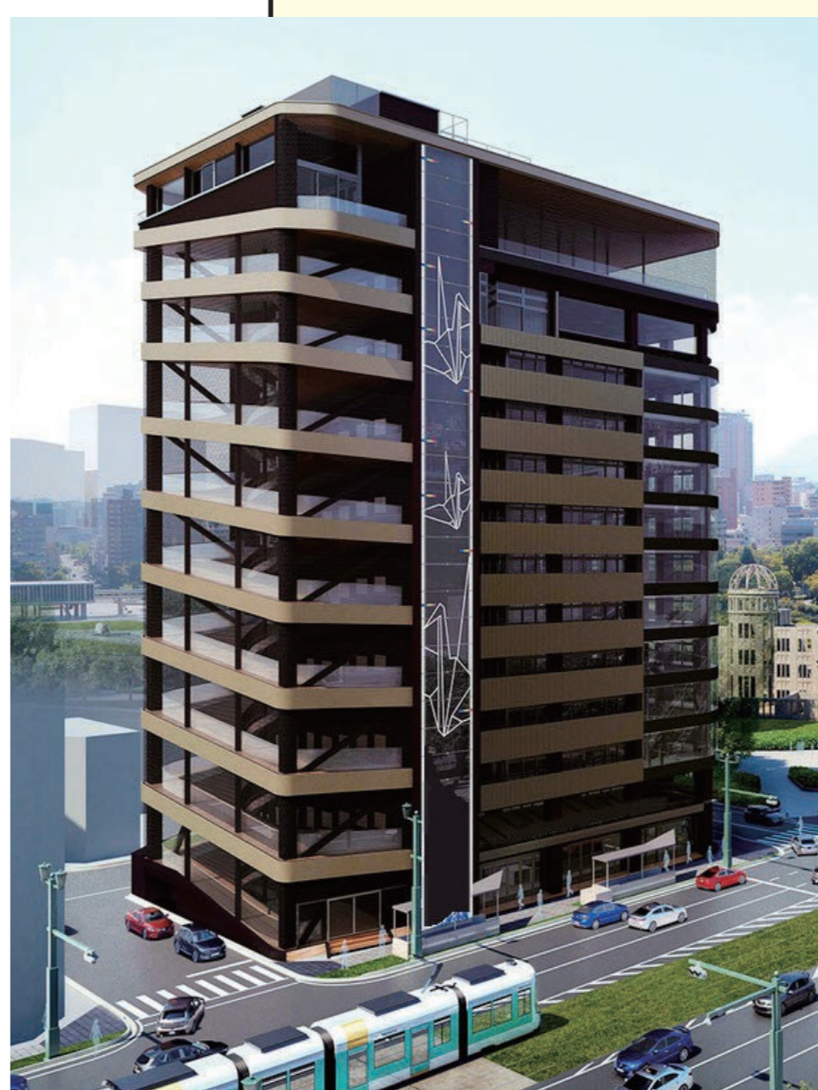
原爆ドーム東隣のおりづるタワー 10階にエソールは移転

2019年 ／令和1年 広島県から「人権啓発指導者等養成等業務」受託 エソール広島の開館日及び開館時間の拡大